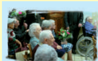
Le 13 décembre 2008, la RPA a célébré ses 20 ans et offert des bouquets aux résidentes les plus anciennes.