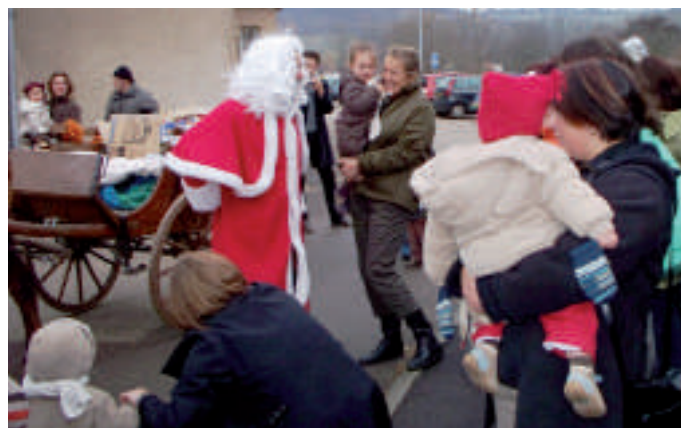
Quand le relais et la Halte garderie fêtent Noël