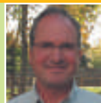
Jean Lanni Réunis pour Givry Appel d'offres, voirie, assainissement, éclairage