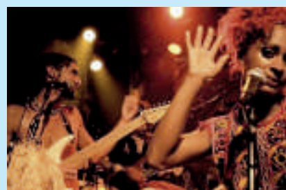
Terrakota se produira au domaine Thénard samedi 28 vers 22 h 30

Office de Tourisme Givry – Côte Chalonnaise 03 85 44 43 36 et sur www.musicaves.fr