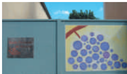
Ecole de Poncey