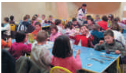
La 2 e salle de restaurant à l'école du Bourg