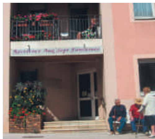
La nouvelle signalétique de la Résidence

Pour participer, n'hésitez pas à vous renseigner à la Résidence au 03 85 44 41 45.