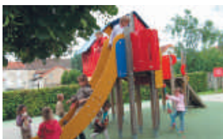
L'aire de jeux à la maternelle Léocadie Czyz