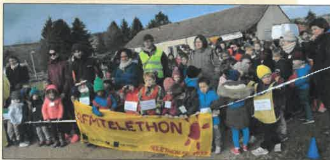
■ Les écoliers givrotins se sont mobilisés.