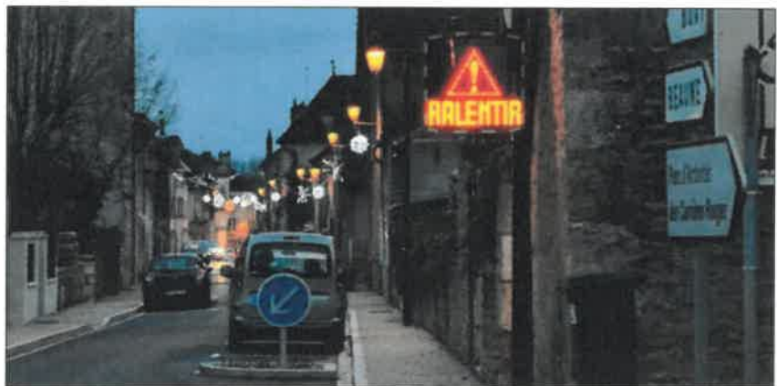
■ Les radars pédagogiques sont parfois impuissants face à l'inconscience de certains usagers.