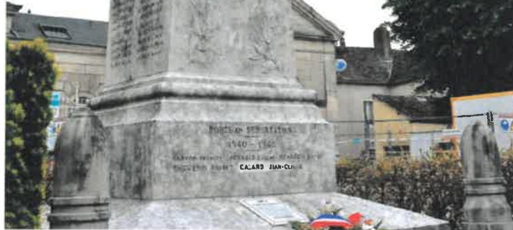
■ En 2018, le monument aux morts quittera la place de la Poste pour être installé au square Thénard.

le déplacement du monument aux morts. Inauguré le 10 août 1920 sur la pla-