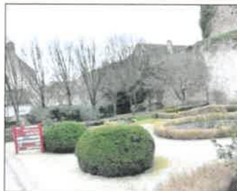
■ Le square Thénard sera le nouvel écrin du monument aux morts de Givry.

Le groupe s'est également abstenu sur la délibération visant à fixer les modalités d'organisation de la journée de solidarité pour le personnel municipal. Le déplacement du monument aux morts, de la place de la Poste au square Thénard, a par