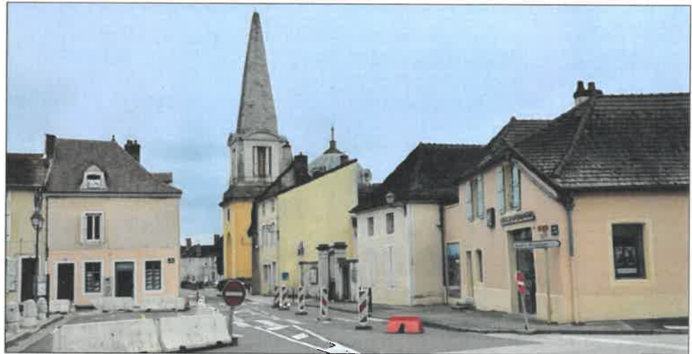
■ L'étude de circulation se poursuit pour la phase 2 du réaménagement du centre bourg.

Mesure phare de la loi de finances 2018, la suppression de la taxe d'habitation pour 80 % des redevables et la confirmation de la compensation intégrale des dégrèvements par l'État, va in-